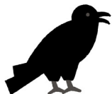
Le corbeau et...

A Dans ses fables, Jean de La Fontaine utilise des animaux pour parler du comportement des humains. Recompose 4 titres de ses fables en reliant les animaux qui vont ensemble.